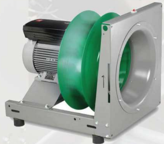
مجموعه موتور و فن