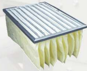
فیلتر کیسه ای